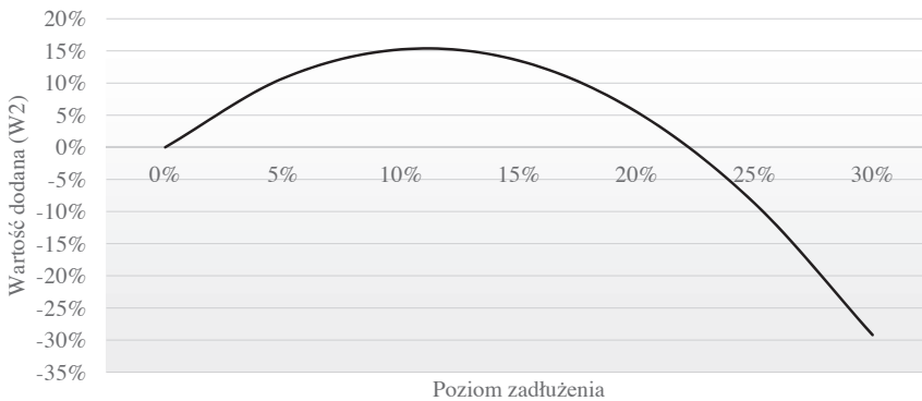
Wykres 2 Graficzna postać funkcji zależności wartości dodanej (W2) od zadłużenia obligacjami korporacyjnymi

W modelu ponownie uwzględniono zmienne włączone na etapie analizy czynnikowej do zmiennej C1, odnoszącej się do finansowania długoterminowego przedsiębiorstwa. Graficznie funkcję zależności wartości dodanej przedsiębiorstwa (zmienna W2) od zadłużenia długoterminowego obligacjami korporacyjnymi przedstawiono na wykresie 2.